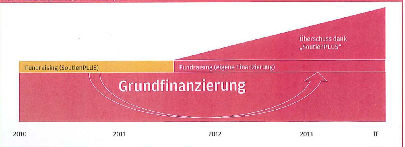
Das Finanzierungskonzept von Soutien plus

Die Grundüberlegung von „Soutien PLUS“ ist schnell umrissen: Je besser eine soziale Organisation in der Lage ist, aus eigener Kraft neue Unterstützer zu gewinnen, desto nachhaltiger kann sie ihre Arbeit gestalten. Diese Anstrengung erfordert allerdings Zeit und Geld – an beidem mangelt es sozialen Organisationen typischerweise chronisch, sodass sie oft